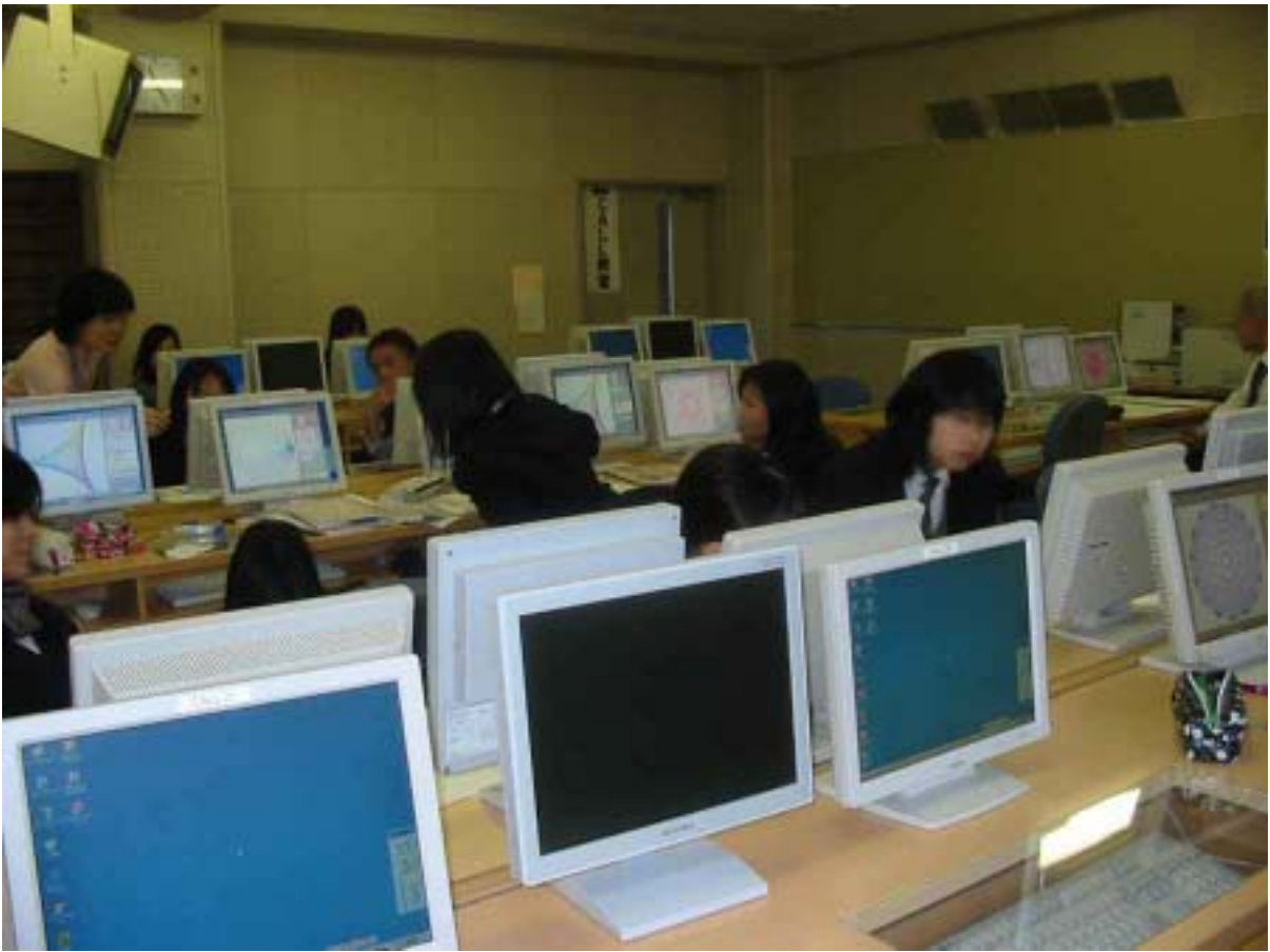
3校時_対角線でお絵かき