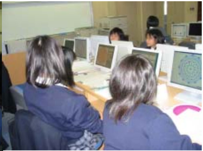
2 校時_正 12 角形の対角線