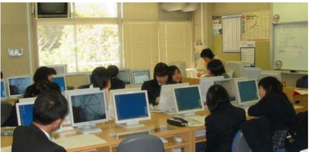
3 校時_a=2k の時の対角線の作図